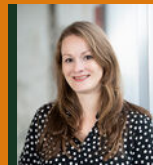
Aya Hustings Nieuwbouwconsulente